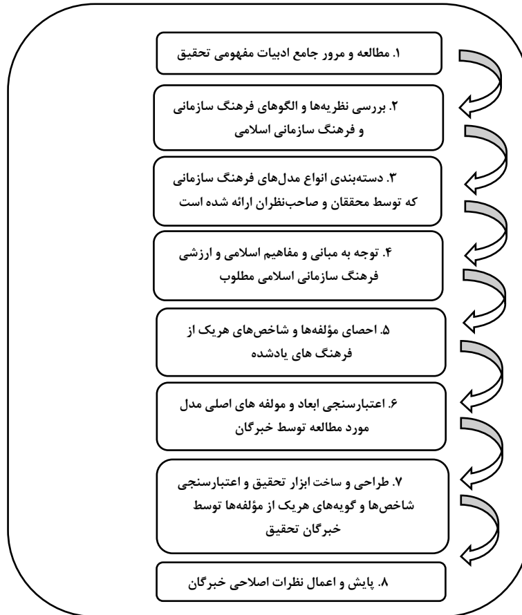
شکل ۲. گام‌های کلی پژوهش