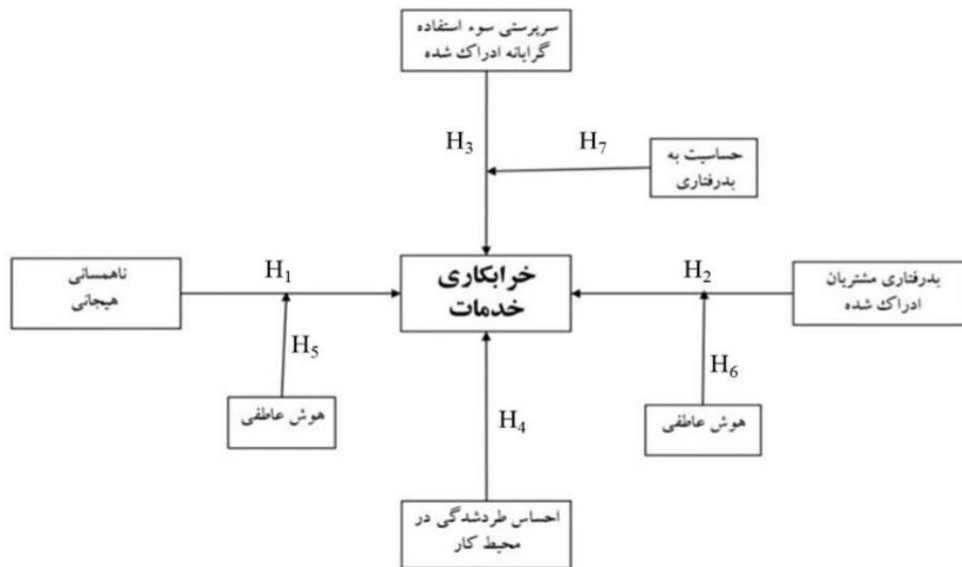
شکل ۱. مدل مفهومی اولیه پژوهش (پژوهش‌های پارک و کیم (۲۰۱۹)، ما و همکاران (۲۰۲۰)، تائو و همکاران (۲۰۱۹)، علی پور و همکاران (۲۰۲۱)، لی و اکی (۲۰۱۴)، سرور و همکاران (۲۰۲۰))