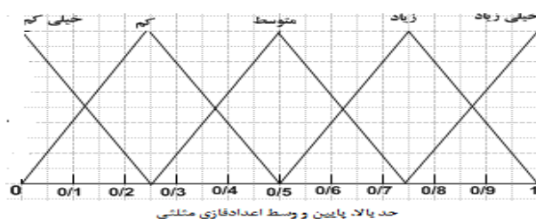
شکل ۱. تعریف متغیرهای زبانی

در پژوهش حاضر، پس از مصاحبه با خبرگان، عوامل در قالب پرسشنامه با هدف کسب نظر خبرگان راجع به میزان موافقت آنها با عوامل طراحی شد و خبرگان از طریق متغیرهای کلامی خیلی کم، کم، متوسط، زیاد و خیلی زیاد میزان موافقت خود را ابراز کردند. از آنجا که خصوصیات متفاوت افراد بر تعابیر ذهنی آنها نسبت به متغیرهای کیفی اثرگذار است، لذا با تعریف دامنه متغیرهای کیفی، خبرگان با ذهنیت یکسان به سؤال‌ها پاسخ دادند. این متغیرها با توجه به شکل (۱) و جدول (۵) زیر به شکل اعداد فازی مثلثی تعریف شده‌اند.